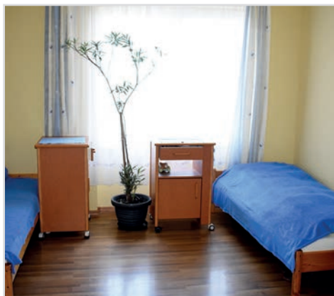
Camere cu 2 paturi