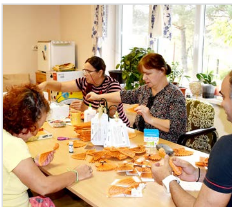
Centrul oferă o gamă largă de activități creative, printre ele și lucru manual