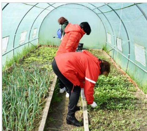
Beneficiarii se pot implica în cultivarea de legume proaspete și gustoase