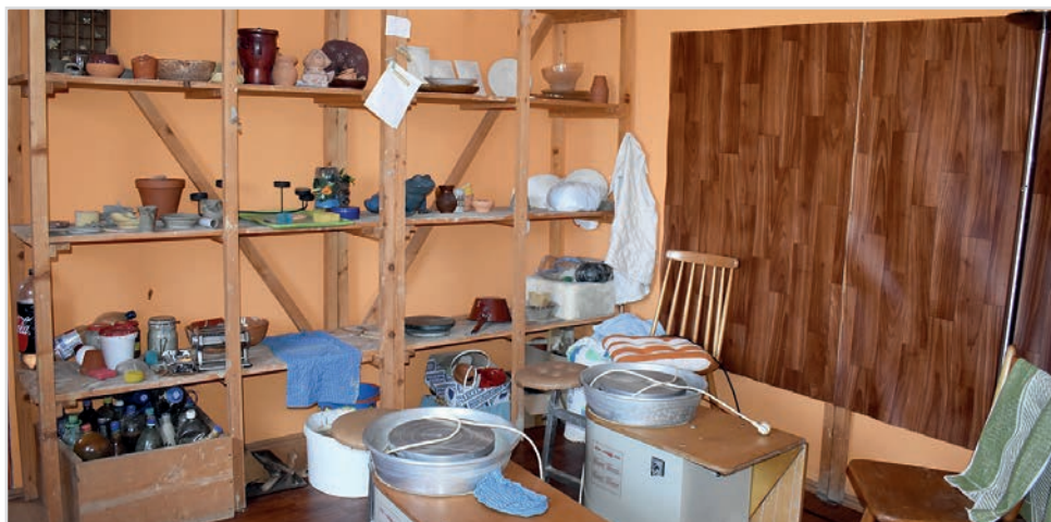
Atelierul de olărit