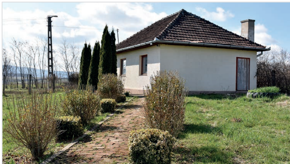
Casa de creație