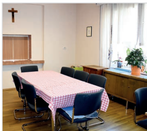
Sala de mese