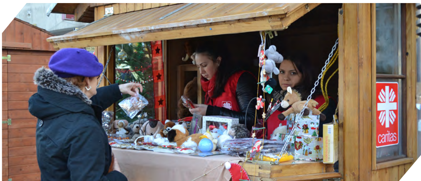
Mikulás Bazarunkban vásárlással segítettek a rászorulókon