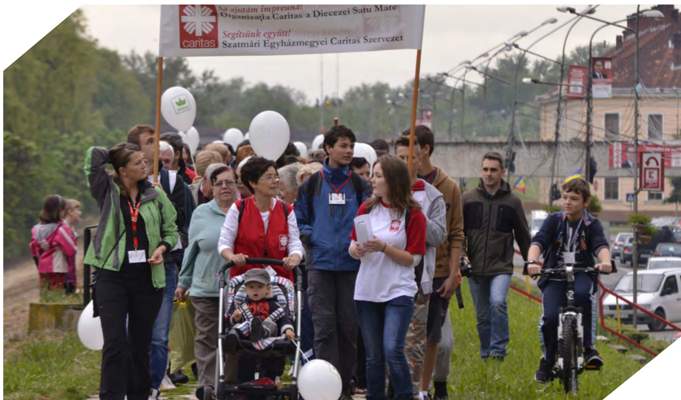
2014. május 17. Jótékonyági Maraton a rászoruló családokért, több mint 350 résztvevővel