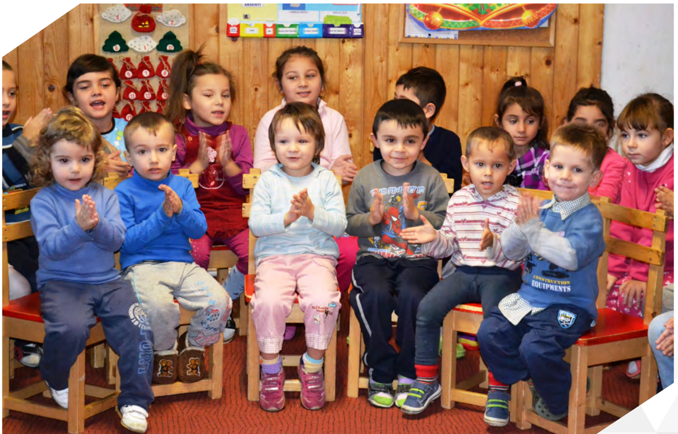
A közös együttlétek mindig mosolyt csálnak a gyermekek arcára