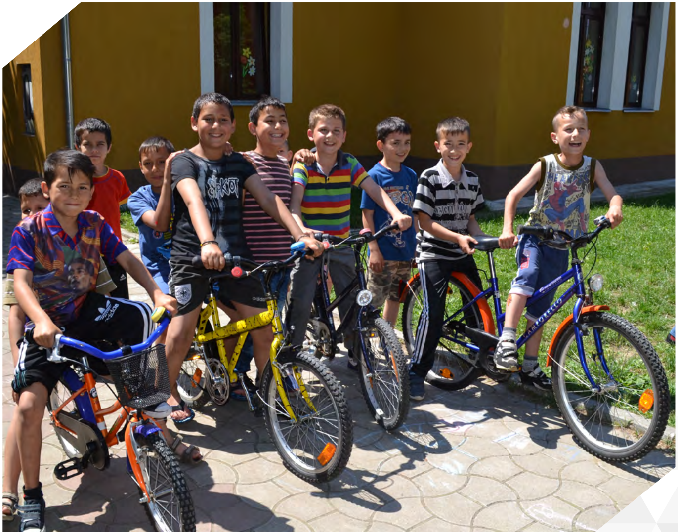
Az egészséges mozgásformák közül is a leghatékonyabb a nevetés előidézte mozgás